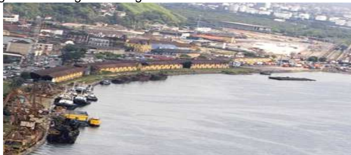
Figura 4 – Imagem da região do nascedouro do Porto de Santos

A revitalização do porto consiste em renovar áreas consideradas obsoletas com o objetivo de modernização e para que possa ser incluído como “roteiro turístico e de desenvolvimento social” (PDZPS, 2006; p. 163-164). E como proposta, o Porto de Santos têm uma região que é considerada “o espaço de maior importância histórica e cultural de Santos – nascedouro do Porto de Santos, e que deve gerar imensa expectativa de revitalização” (PDZPS, 2006; p. 164).